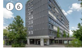
i Information/Empfang 6 Haus Allegra Badstrasse 30

«Als Stiftung erfüllen wir einen öffentlichen Auftrag. Wir bilden, begleiten und unterstützen Kinder, Jugendliche und Erwachsene mit primär kognitiven Behinderungen oder anderen Entwicklungsauffälligkeiten.»