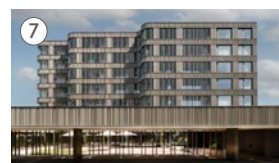
7 Haus Fortuna Badstrasse 34