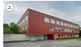
2 Heilpädagogische Schule Badstrasse 10