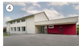
4 Mehrzweckgebäude Badstrasse 16