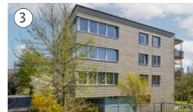
3 Haus am Rank Luzernerstrasse 5