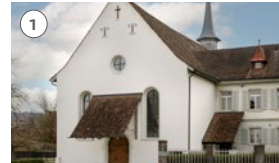
1 Kapuzinerkirche/Klösterli Luzernerstrasse 1