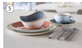
5 Restaurant JoJo Badstrasse 30