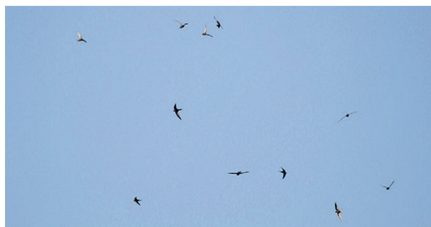
Meist sieht man sie nur hoch am Himmel. Doch zum Brüten sind die Mauersegler auch gerne unter den Giebeln der Bremgartener Altstadt Häuser.

«Auf dieser geführten Tour lernen wir zusammen mit dem Artenspezialisten den Lebensraum der Gebäudebrüter Bremgartens kennen», heisst es in der Einladung der Veranstalter von «Läbigs Bremgarte».