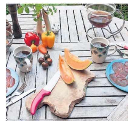
Die Veranstalter sind gespannt, womit sich die Tische füllen werden.

Mit der Tavolata soll das nachbarschaftliche Miteinander gestärkt und ein lebendiger Austausch im Quartier gefördert werden. Alle Bewohnerinnen und Bewohner sind dazu eingeladen, gemeinsam Zeit zu verbringen und neue Kontakte zu knüpfen. Das Konzept ist einfach und verbindend: Wer teilnimmt, bringt etwas für das gemeinsame Buffet mit – etwa Snacks,