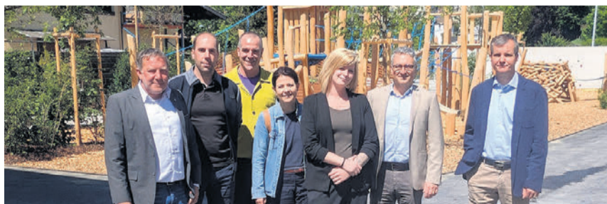
Die Verantwortlichen freuen sich über ein Gemeinschaftswerk.