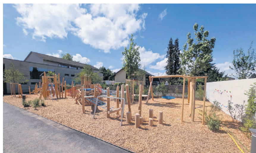
Spieleräte, gemütliche Ecken und Pflanzen. Der Platz präsentiert sich äusserst einladend.