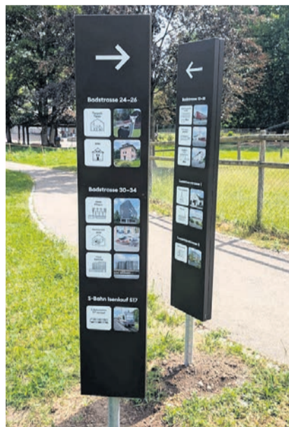
Einheitliche Signaletik: Sowohl draussen...