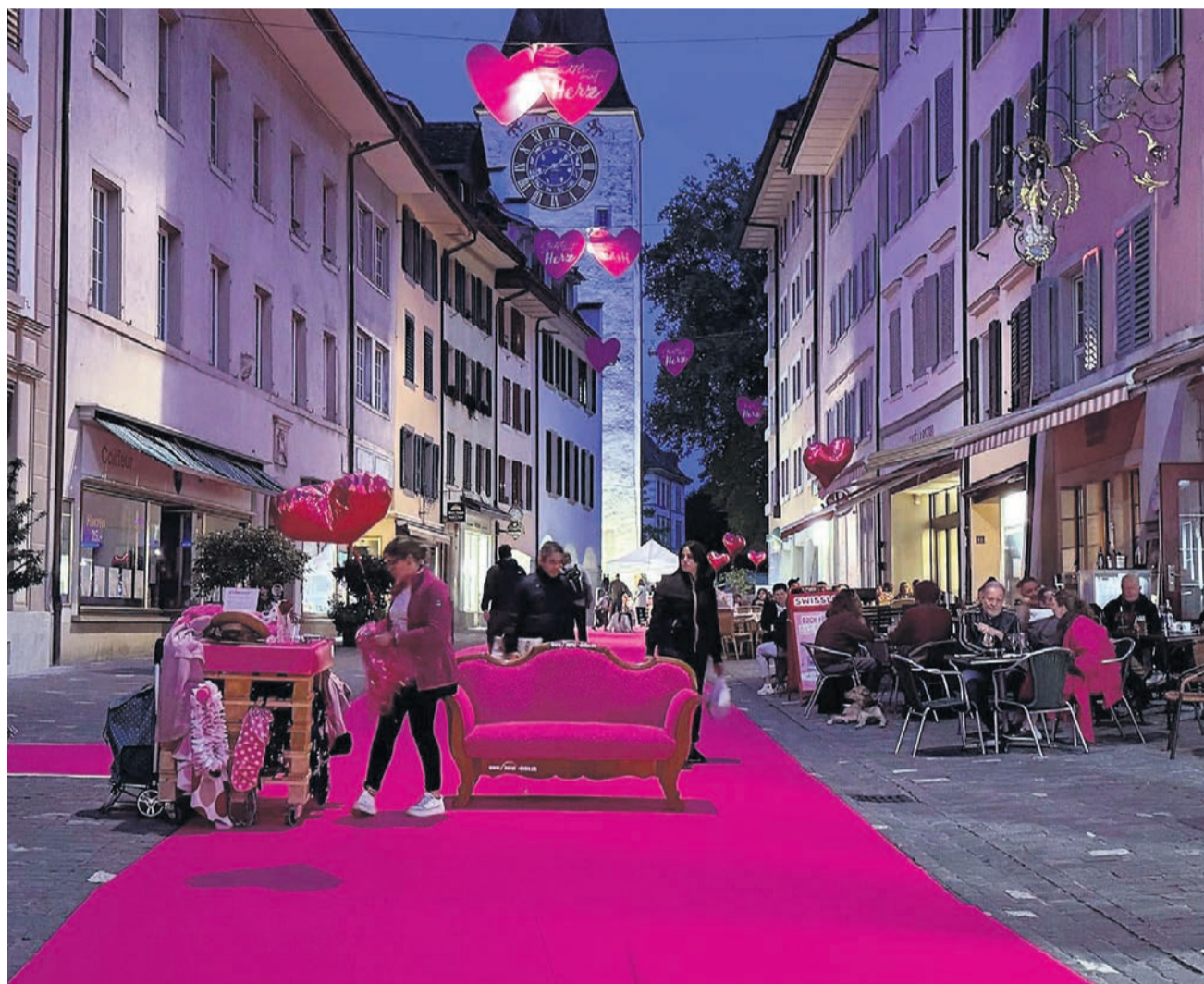
Am 12. und 13. Juni erstrahlt die Bremvgarter Altstadt erneut in Pink – und lädt zu Talk und Modeschau.

Gleich zweimal wird das Ganze in der Marktgasse zu bewundern sein. «Im Moment, in dem das Städtli beschliesst, kurz zur Fashion Week zu werden», wie die Veranstalter mit einem Augenzwinkern ankündigen.