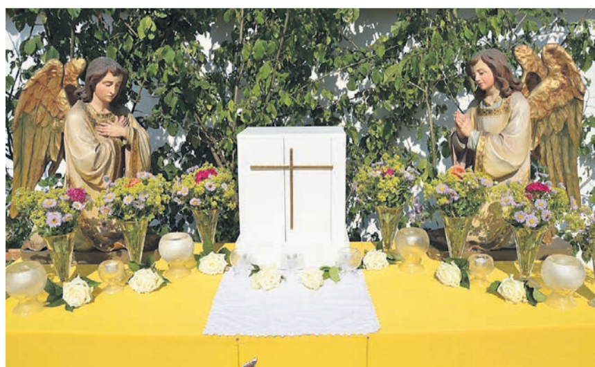
Am Donnerstag gibt es wieder Blumengebinde und Altäre im Kirchenbezirk.

An Fronleichnam versammeln sich die Bremgarter Katholiken, um gemeinsam ein sichtbares Zeichen des Glaubens und der Gemeinschaft zu setzen. Nach dem Gottesdienst in der Stadtkirche zieht die Prozession durch die mit Blumen gesäumten Strassen im Kirchenbezirk. Blumengebinde und Altäre am Wegesrand verleihen der Feier eine besondere Atmosphäre und machen den traditionellen Brauch zu einem eindrücklichen Erlebnis. Begleitet von Blasmusik der Bremgarter Stadtmusik, Gebet und Gesang wird das Allerheiligste durch die Strassen getragen – ein